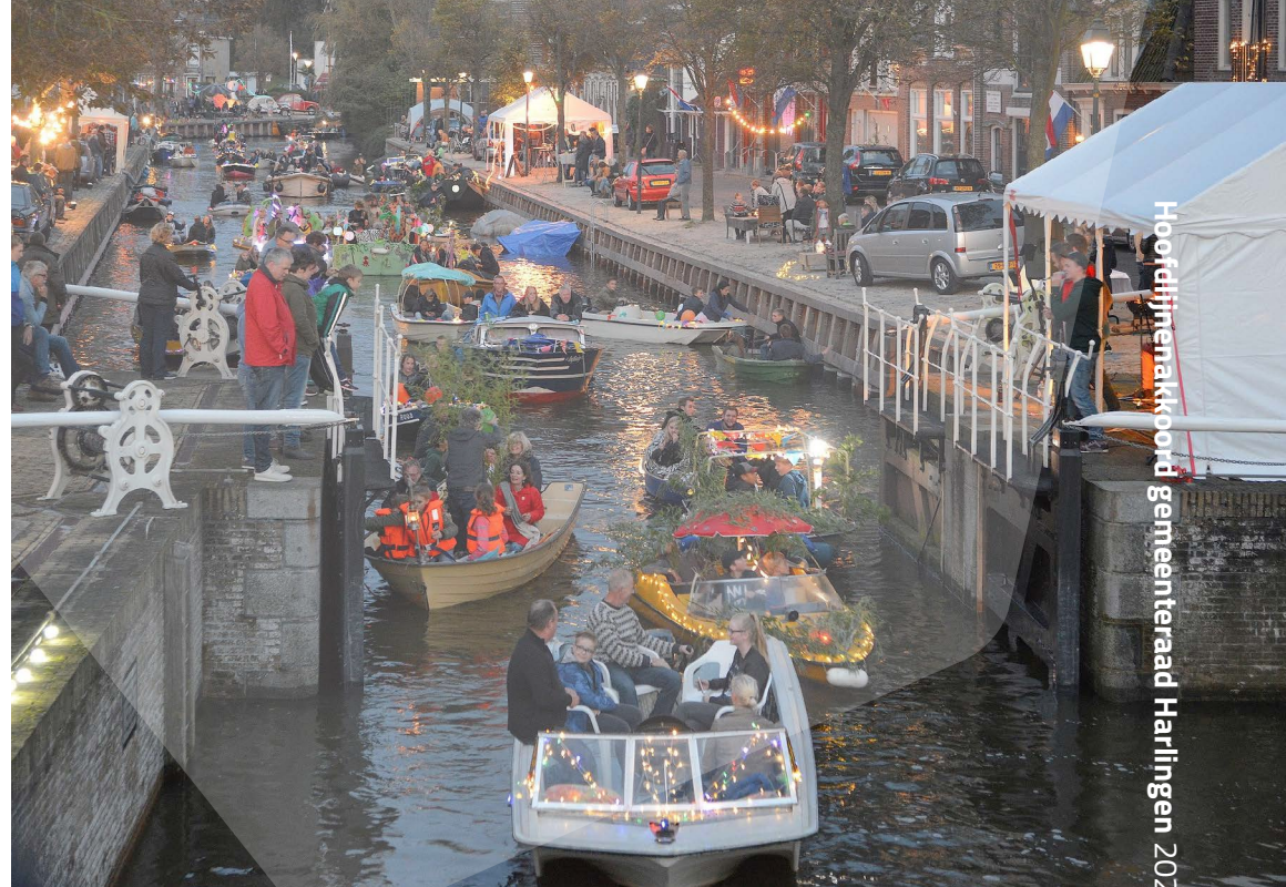
Hoofdfijnakkoord gemeenteraad Harlingen 2022-2026

Specifiek voor Spijkerstad heeft de gemeenteraad het streven om tot een vaste locatie te komen. Voor dit type evenementen en breder wil de raad een betere ondersteuning voor initiatiefnemers daarvan. Startend met het invoeren van een servicepakket van de gemeente voor de organisatoren van evenementen in de gemeente.