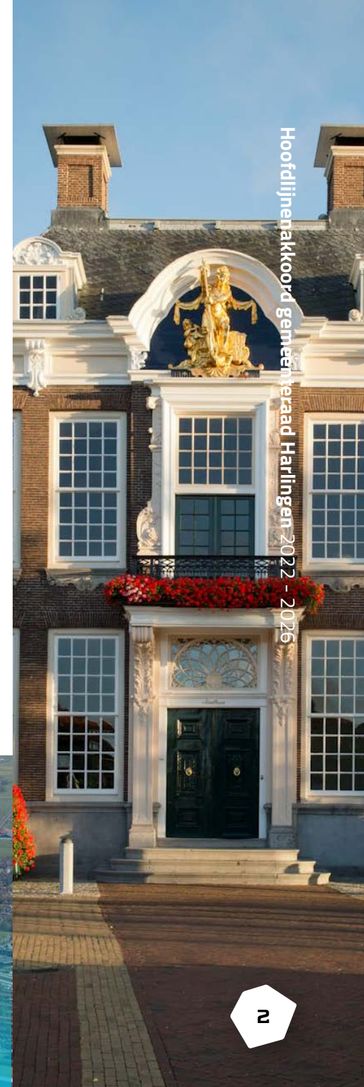
Hoofdlijnenakkoord gemeenteraad Harlingen 2022 - 2026